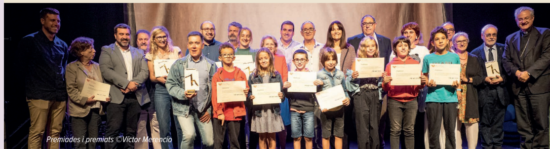
Premiades i premiats