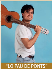
“LO PAU DE PONTS”